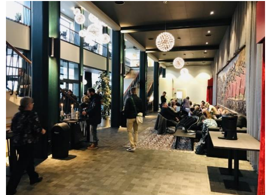
SAS Ljud- & Ljudmiljöpris

måndag 3/3, till info@akustiska-sallskapet.org